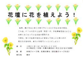
生徒への呼びかけポスター