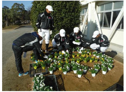
白い花でボールとバットを描く野球部員