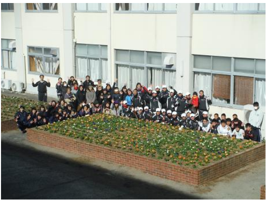
参加者全員で花壇の前でポーズ