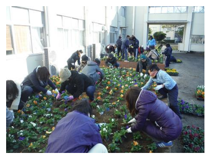
メインの花壇に「三好」の文字を描いています

植えたばかりでは、「三好」の文字ははっきりわかりませんが、3月、4月になると苗が育って見事なできばえになります。土の部分がすべて花で覆われます。卒業、入学のお祝いの時期が見頃であり、完成形となります。