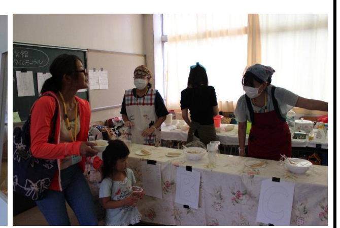
食品バザーの様子