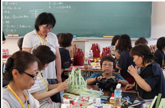
研修会 バッグ作成中 その1

◇PTA食品バザー 「何か子供たちが文化祭で楽しめることがしたい」とこのような思いがPTA食品バザーにつながり、初めての開催として「わらびもち」を販売させていただきました。 子供たちはどんな食べ物を販売したら喜んでくれるのだろうか、食品を扱うことの難しさ、仕入れや販売の方法等、すべてが不安でした。 文化祭当日、前売りチケットを持った子供たちが来てくれて、「おいしい！」と言ってくれた時はとてもうれしかったです。 たくさんのPTA役員さんにお手伝いをいただき、二日間の食品バザーを成功させることができました。来年度以降も子供たちが楽しめるような企画を考えていきたいです。