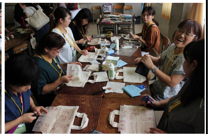
体験講座 小物作成中 その2

◇PTA研修会 開催した講座は「クラフトバンドで作るバッグ製作」です。クラフトバンドを一つひとつ丁寧に編みこみながらバッグを作っていきます。事前に参加者と作製するバッグの色の希望を調査したこともあり、当日は順調に講座が始まりました。講師の先生が一から丁寧に教えてくださり、赤・黒・ミント・ベージュの参加者の個性が表れた素敵なバッグを完成させることができました。参加した皆さんが作る楽しさを実感することができたように思いました。笑顔あふれる和やかな雰囲気の中、バッグを作製するだけでなく、日頃の子育ての悩みから進路の話まで有意義な情報交換を行うこともできました。