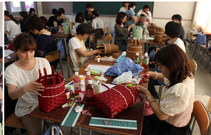
研修会 バッグ作成中 その2