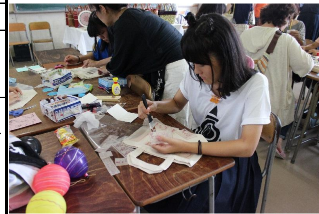
体験講座 小物作成中 その1

◇文化祭PTA企画(体験講座・作品展示) 体験講座は、会場に来てくれた生徒や保護者の方々に『カバンのデコパージュ、プラ板アクセサリ、くるみボタン、スイーツ粘土デコ』作製の体験をしてもらいました。作品展示は、PTA研修会で作製した『クラフトバンドで作ったバッグ』や保護者が作成した『手芸品』を展示しました。 来ていただく皆様に喜んでいただけるよう、教室内の飾り付けなどを工夫しました。体験講座では一人でも多くの方に来ていただけるように作品の種類を多くしました。そして一人ひとり丁寧に対応するため、PTA役員の方に講師として応援に来ていただきました。毎年好評な体験講座ですが、今年度は例年以上に来客数が多く、参加者は114名にもなり大盛況となりました。保護者だけでなく、教職員や生徒も多数参加していただきました。「楽しい！もっとやりたい！」という声が聞け、とても盛況のうちに終わることができました。役員の方々が一致団結して取り組み、楽しく充実した文化祭企画になりました。