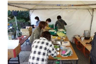
ねぎ・油揚げ・天かす