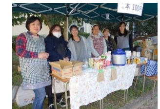
コーヒー・タルト販売準備完了