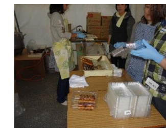
みたらし団子のパック詰め