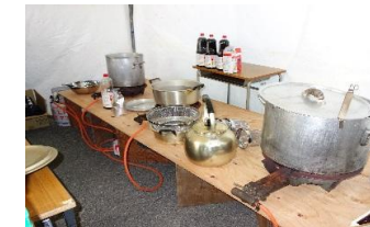
うどん用ガスコンロ配置