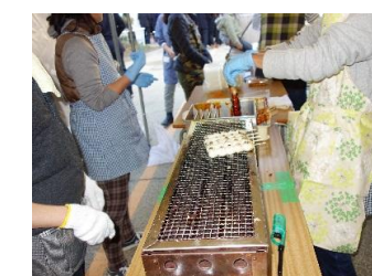
みたらし団子を焼く