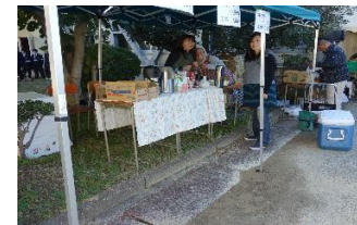
コーヒー・タルト販売