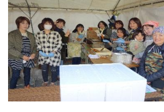
みたらし団子販売準備完了