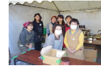
うどん販売準備完了