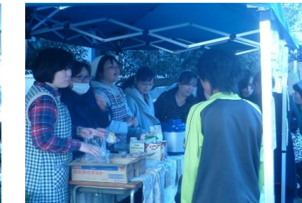
コーヒー・タルト