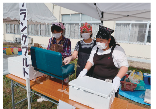
メインイベントの黒潮祭