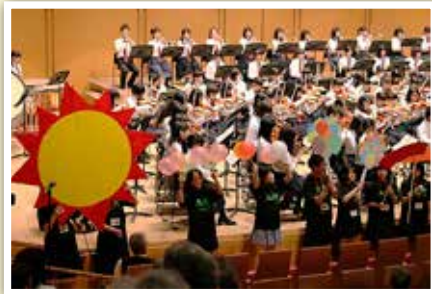
「平成26年度アートフェスタ フィナーレ」

日本音楽、合唱、吹奏楽、器楽・管弦楽、フィナーレ (毎年、生徒実行委員会がフィナーレの演出を考えます。)